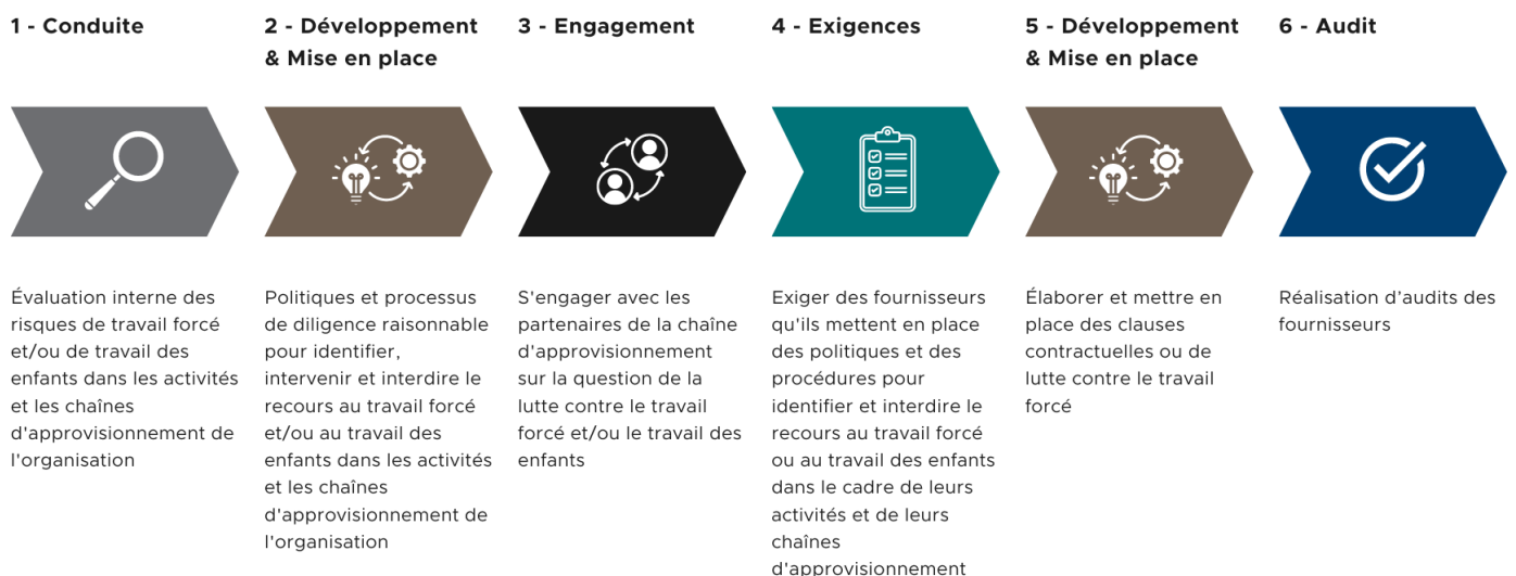
Figure 1: Processus en plusieurs étapes pour identifier et réduire le risque de travail forcé et de travail des enfants

De plus, TORLYS a participé à un examen du secteur des revêtements de sol en tant que membre du Resilient Floorcovering Institute. À titre de participant, TORLYS a rempli un questionnaire concernant la chaîne d'approvisionnement de l'entreprise et son exposition à des produits fabriqués à l'aide de travail forcé dans la région autonome ouïgoure de Xingjiang (XUAR). L'examen du secteur a permis d'identifier les risques potentiels liés à l'approvisionnement en PVC chinois, un ingrédient clé dans la production de vinyle. L'audit a permis d'établir un ordre de priorité pour les actions mentionnées au point 3(b) de la section sur la gouvernance.