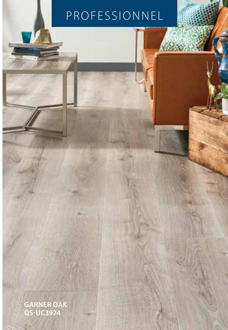
GARNER OAK QS-UC3924