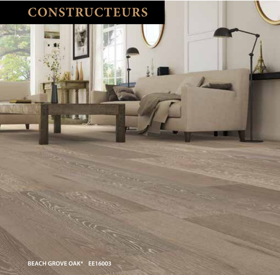
BEACH GROVE OAK* EE16003