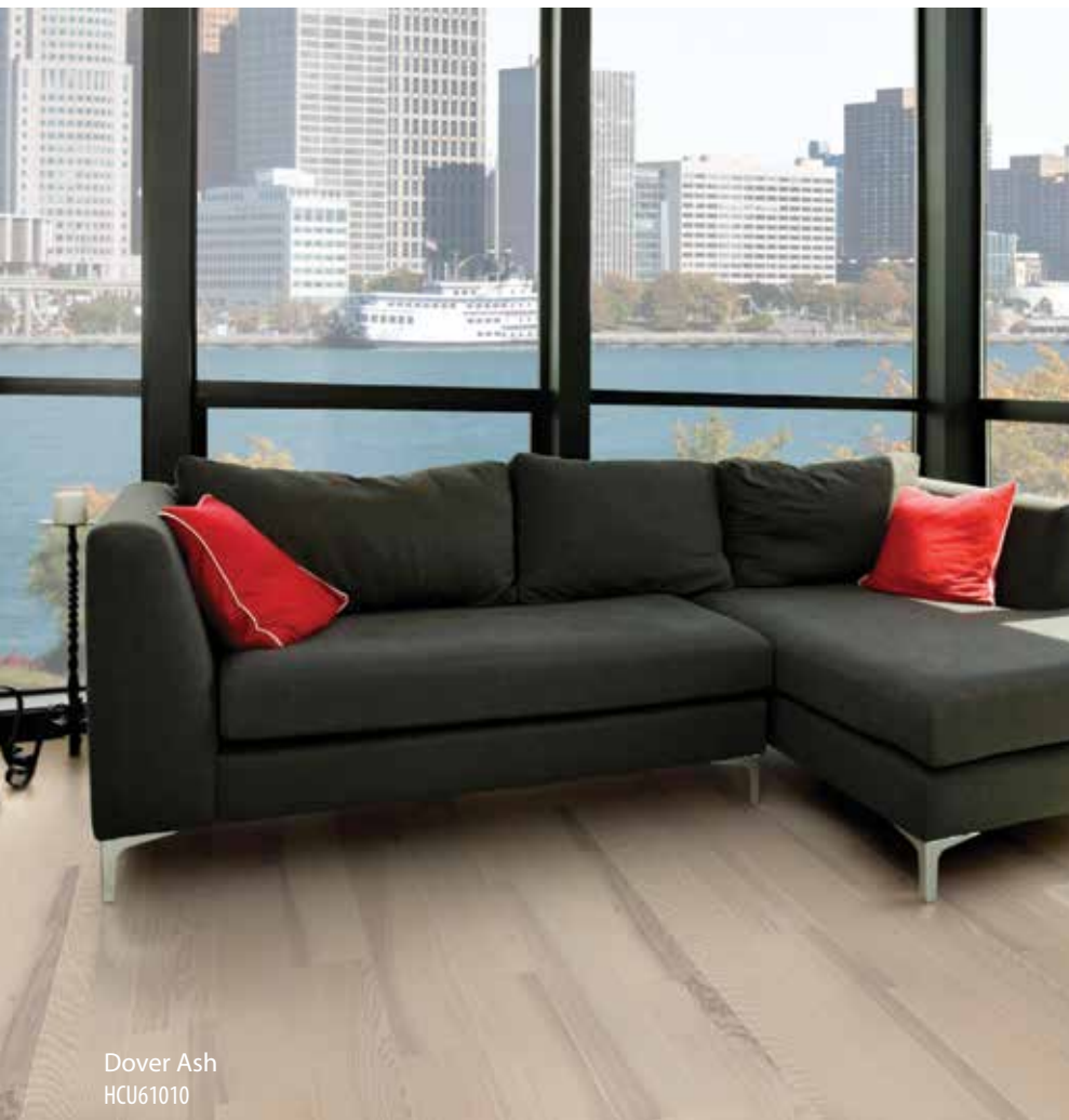
Dover Ash HCU61010

Des planches larges. Des couleurs naturelles. Un fini huilé. La collection Summit Premier TORLYS est d'une élégance abordable qui rehaussera toute décoration.