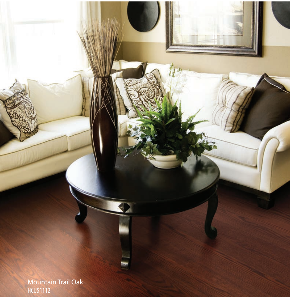
Mountain Trail Oak HCU51112

La beauté sans pareille du bois en planches de 4 7/8 pouces de largeur et de 47 3/8 pouces de longueur.