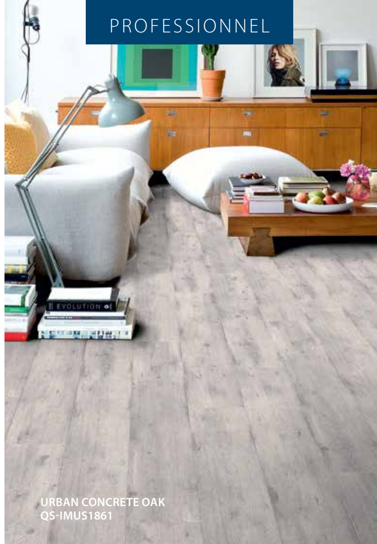
URBAN CONCRETE OAK QS-IMUS1861