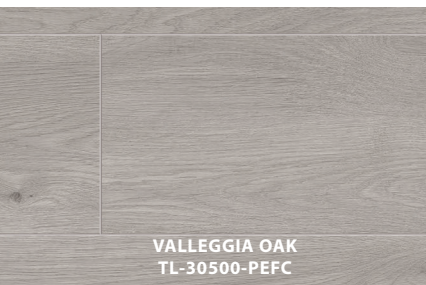
VALLEGGIA OAK TL-30500-PEFC