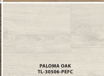
PALOMA OAK TL-30506-PEFC