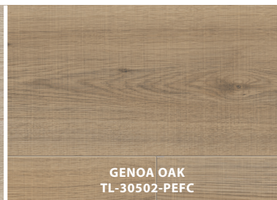
GENOA OAK TL-30502-PEFC