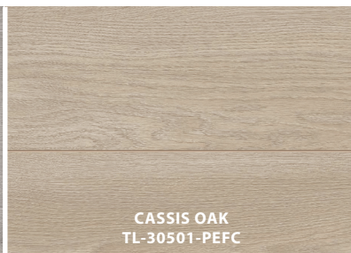
CASSIS OAK TL-30501-PEFC