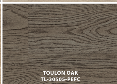
TOULON OAK TL-30505-PEFC