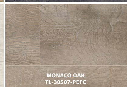
MONACO OAK TL-30507-PEFC