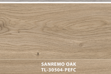
SANREMO OAK TL-30504-PEFC