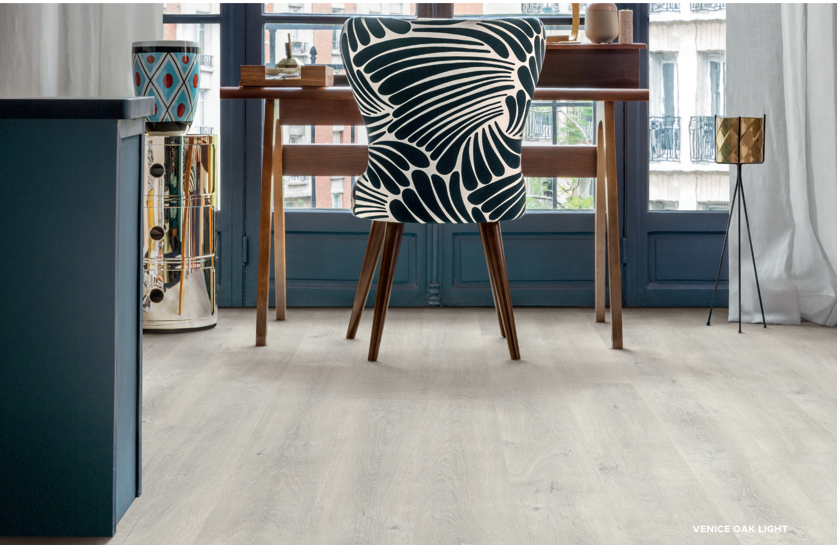
VENICE OAK LIGHT

TORLYS Maxx FINI COMMERCIAL Antimicrobien · Anti-rayure