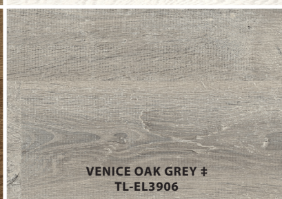
VENICE OAK GREY ‡ TL-EL3906