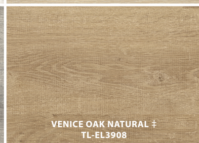
VENICE OAK NATURAL ‡ TL-EL3908