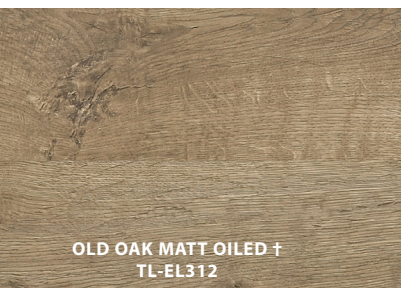
OLD OAK MATT OILED † TL-EL312