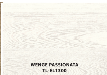
WENGE PASSIONATA TL-EL1300