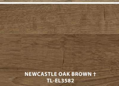
NEWCASTLE OAK BROWN † TL-EL3582