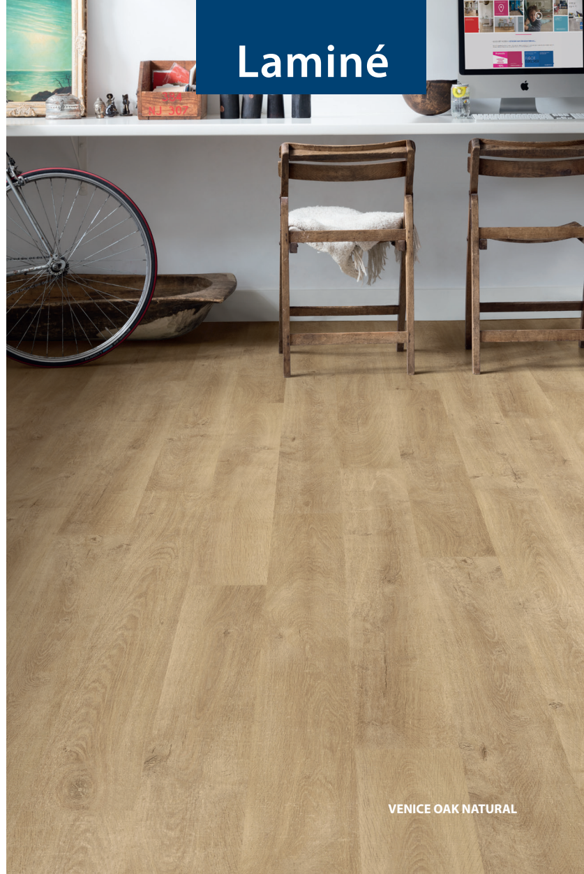
VENICE OAK NATURAL

† Variation marquée des nuances ‡ Faible variation des nuances