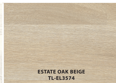
ESTATE OAK BEIGE TL-EL3574