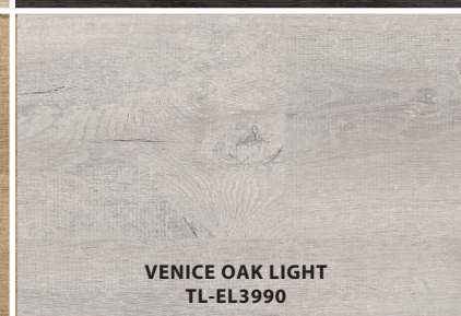
VENICE OAK LIGHT TL-EL3990