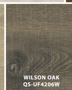
WILSON OAK QS-UF4206W