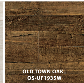
OLD TOWN OAK † QS-UF1935W