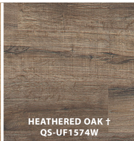
HEATHERED OAK † QS-UF1574W