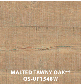
MALTED TAWNY OAK** QS-UF1548W