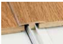
Moulure en T

Moulure en T, à nez carré, de réduction, et nez de marche encastré dans UN seul profil.