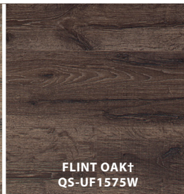
FLINT OAK † QS-UF1575W