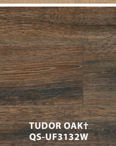
TUDOR OAK † QS-UF3132W