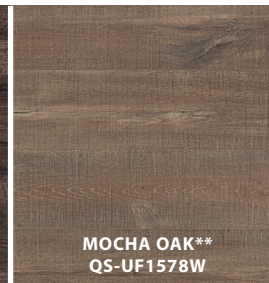
MOCHA OAK** QS-UF1578W