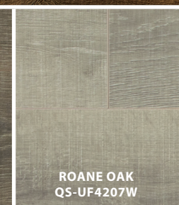
ROANE OAK QS-UF4207W