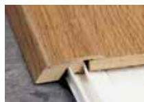
Moulure de réduction