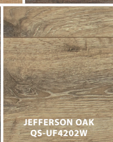
JEFFERSON OAK QS-UF4202W