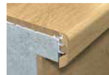
Nez de marche encastré*

*Une sous-base d'aluminium est requise pour les installations du nez de marche encastré.