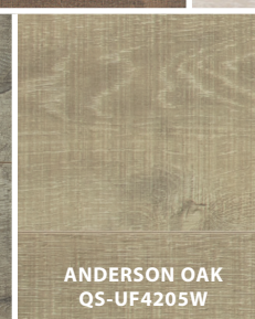
ANDERSON OAK QS-UF4205W