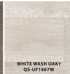
WHITE WASH OAK † QS-UF1667W