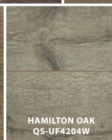
HAMILTON OAK QS-UF4204W