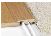
Nez carré - sert à la transition avec un tapis.