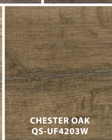
CHESTER OAK QS-UF4203W