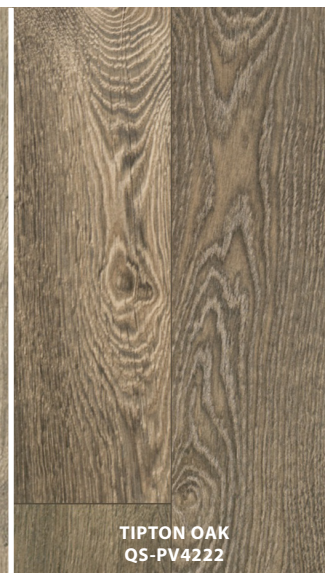
TIPTON OAK QS-PV4222