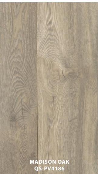
MADISON OAK QS-PV4186