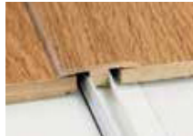
Moulure en T

Moulure en T, à nez carré, de réduction, et nez de marche encastré dans UN seul profil.