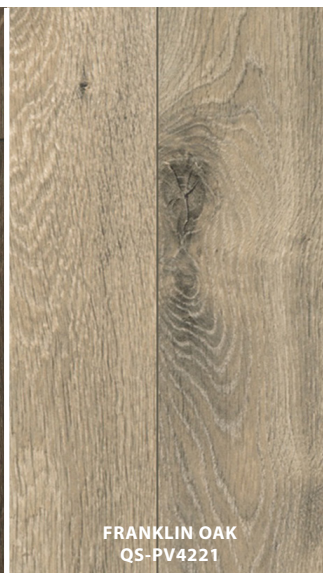
FRANKLIN OAK QS-PV4221