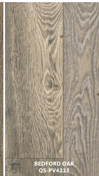
BEDFORD OAK QS-PV4223