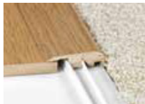
Nez carré - sert à la transition avec un tapis.