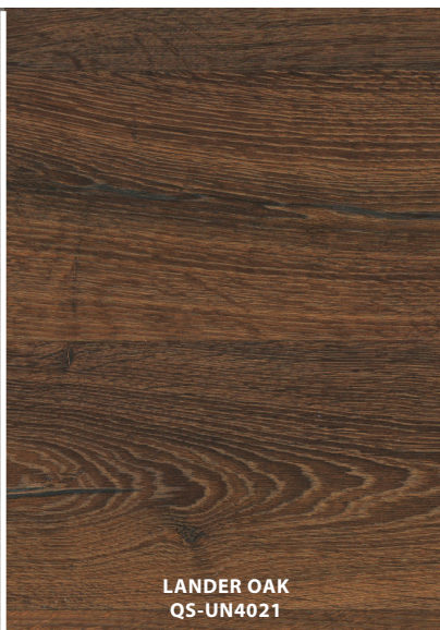
LANDER OAK QS-UN4021