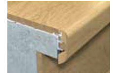
Nez de marche encastré*

*Une sous-base d'aluminium est requise pour les installations du nez de marche encastré.