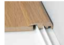
Nez carré - sert à dissimuler l'espace d'expansion sur tout le périmètre de la pièce.