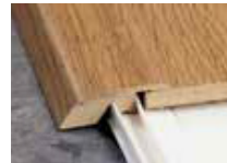
Moulure de réduction