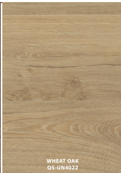
WHEAT OAK QS-UN4022