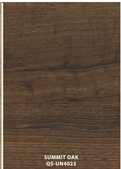
SUMMIT OAK QS-UN4023