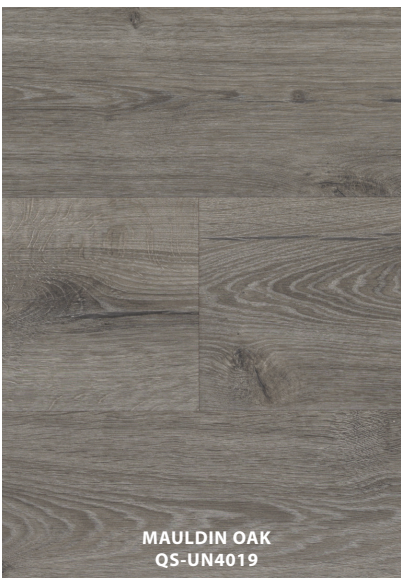
MAULDIN OAK QS-UN4019