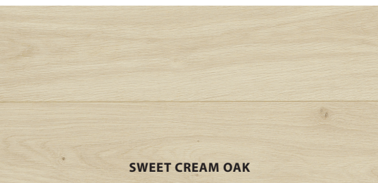
SWEET CREAM OAK