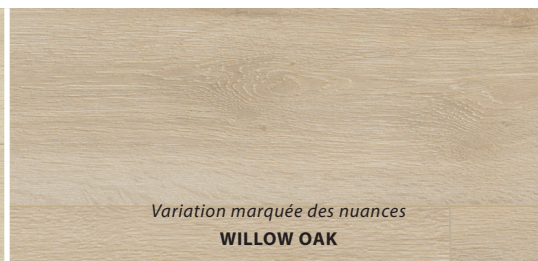
Variation marquée des nuances WILLOW OAK