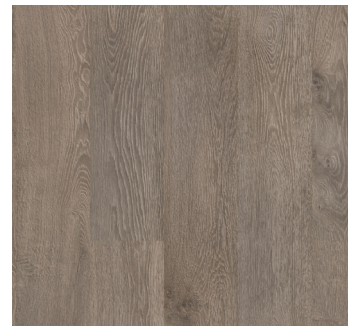
HELEN OAK UP5889