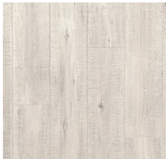
GABLE OAK UP1858