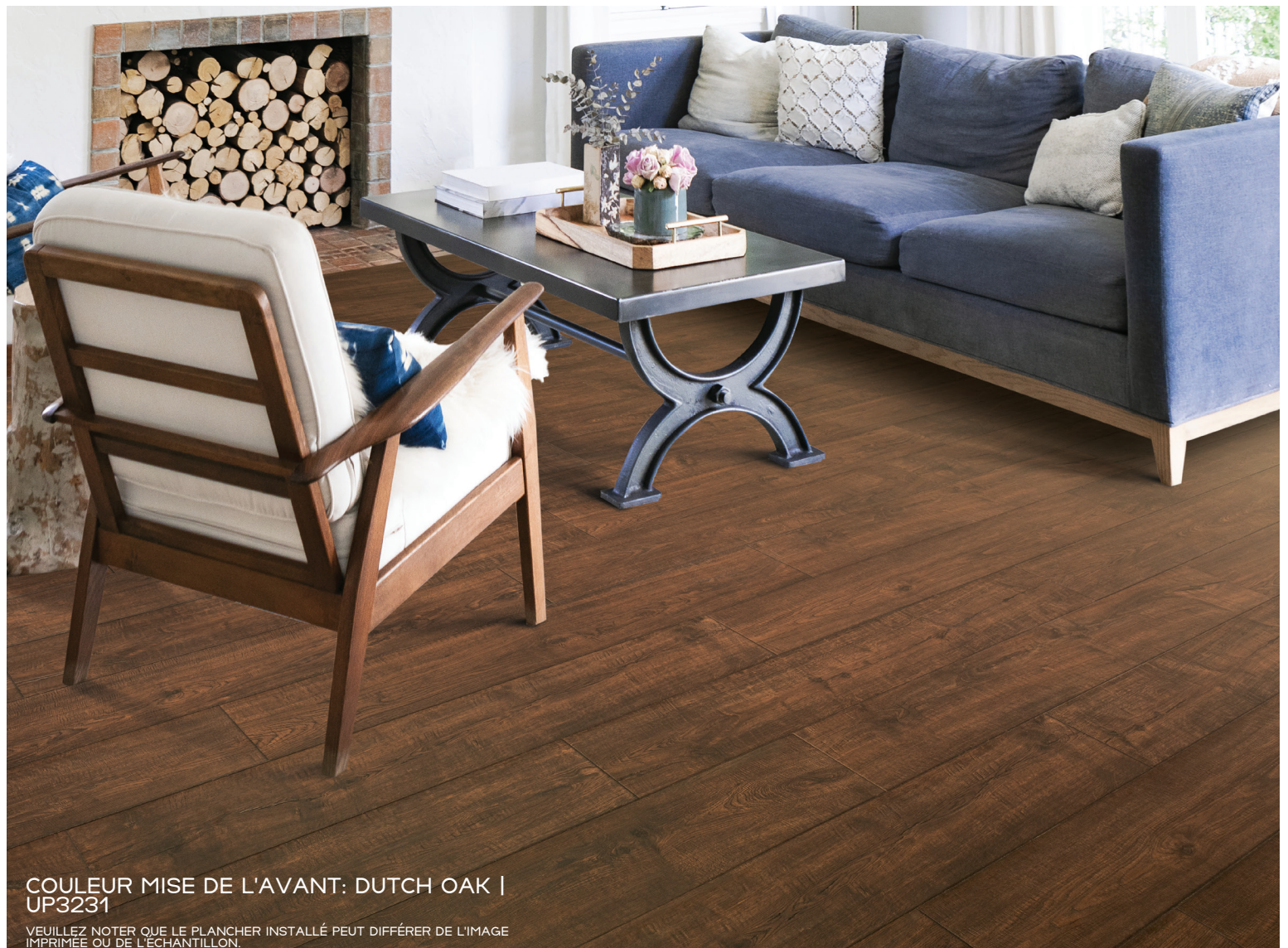
COULEUR MISE DE L'AVANT: DUTCH OAK | UP3231

VEUILLEZ NOTER QUE LE PLANCHER INSTALLÉ PEUT DIFFÉRER DE L'IMAGE IMPRIMÉE OU DE L'ÉCHANTILLON.