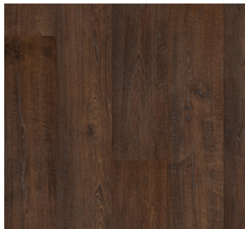
WOODLAND OAK UP3230