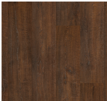
DUTCH OAK UP3231