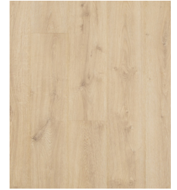
Fawn Oak Natural UP5187