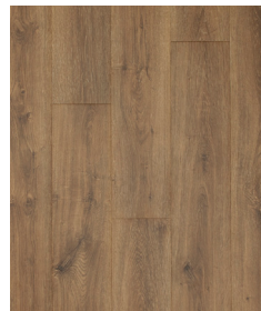
Russet Oak UP5423