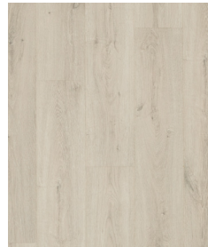
Requisite Oak UP5426