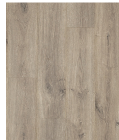
Rocky River Oak UP5424