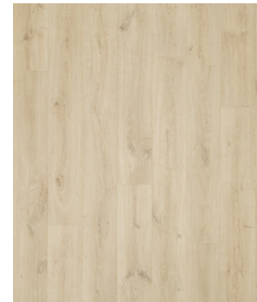
Atoll Oak UP5425