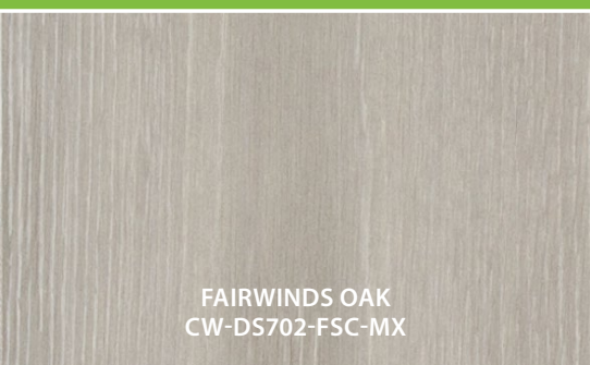
FAIRWINDS OAK CW-DS702-FSC-MX

35-Year Limited Residential Warranty for Wear and a lifetime Structural/Joint Integrity Warranty. Visit torlys.com for details.