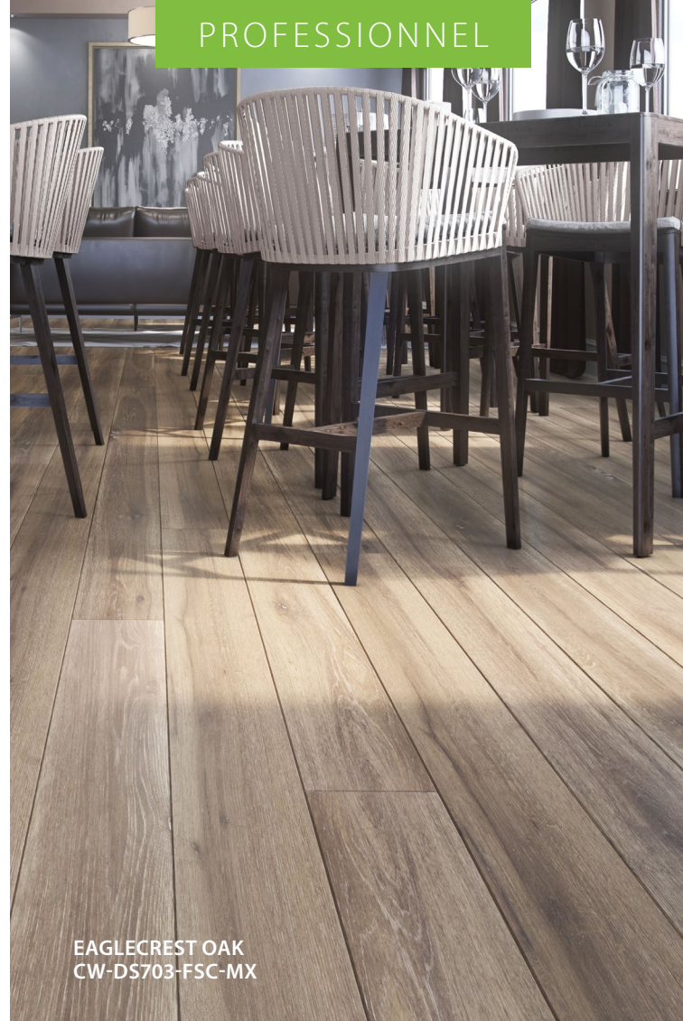
EAGLECREST OAK CW-DS703-FSC-MX