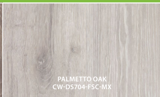
PALMETTO OAK CW-DS704-FSC-MX