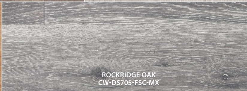
ROCKRIDGE OAK CW-DS705-FSC-MX