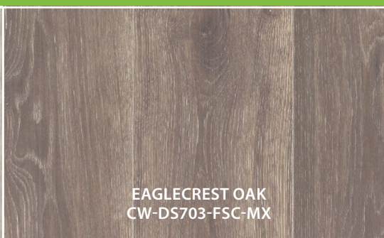
EAGLECREST OAK CW-DS703-FSC-MX